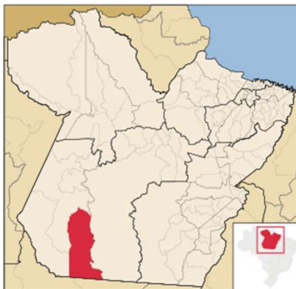
FIGURA 2 – MAPA DE LOCALIZAÇÃO DO AERÓDROMO EM RELAÇÃO A SEDE DO MUNICÍPIO DE NOVO PROGRESSO