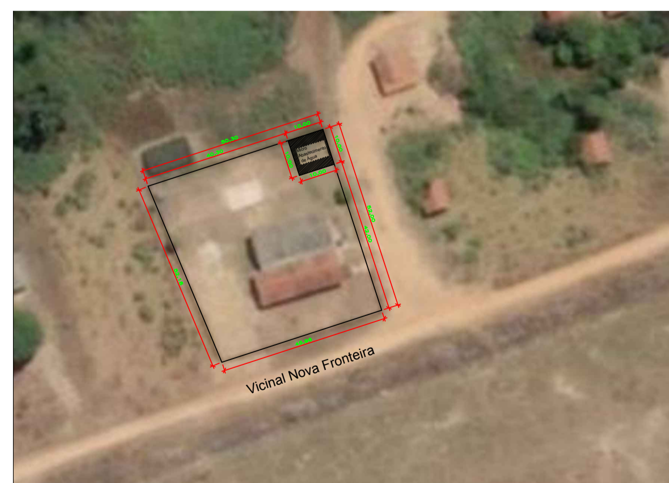
4 Foto Área do Local