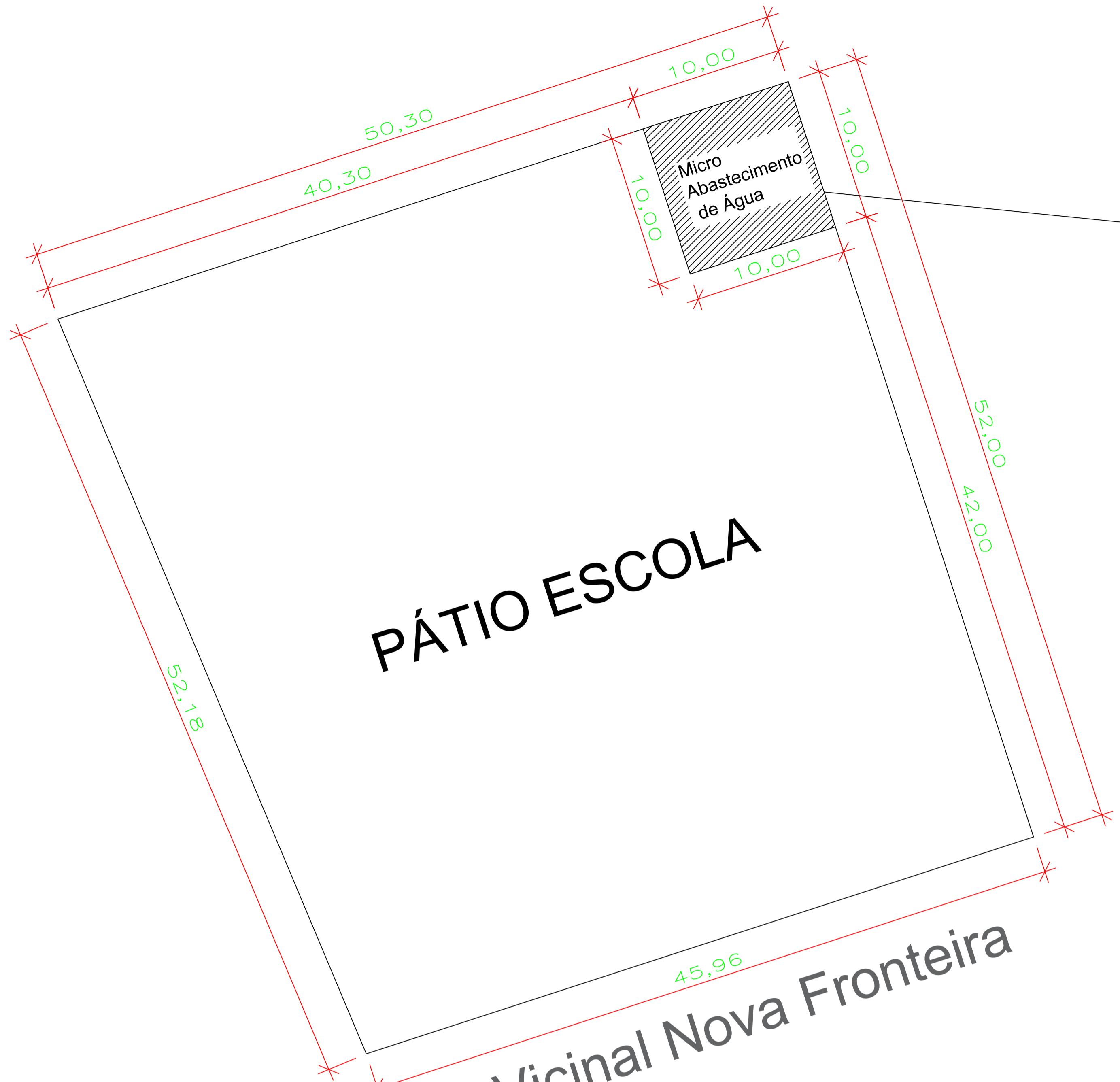
3 Planta Locação Esc.: 1/200