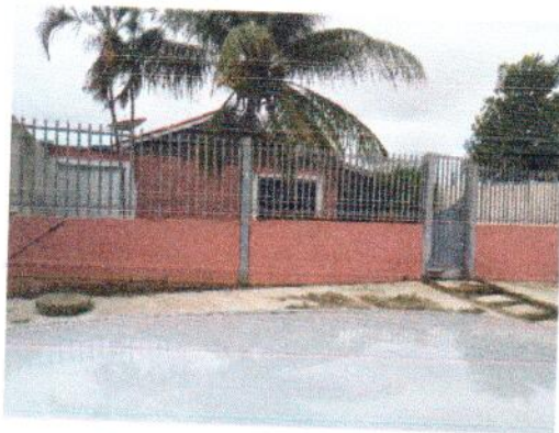
Figura 1 – Imóvel Avaliado

Imóvel está disposto com frente para a Avenida Pará; com base no registro, seu terreno tem uma área de 525,00 m 2 , e uma edificação com área aproximada de 220,00 m 2 , e está cadastrado na Prefeitura Municipal de Novo Progresso.