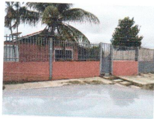
Figura 2 – Imóvel Avaliado