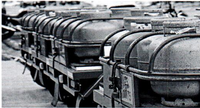
Famílias beneficiárias do programa vão receber neste mês o vale-gás no valor de R$ 52

M esmo com o preço médio do botijão de gás menor do que o divulgado anteriormente, o governo federal decidiu que manterá o vale-gás em R$ 52. Esse será o valor que as famílias beneficiárias do Programa Auxílio Gás vão receber neste mês de dezembro, segundo informações do Ministério da Cidadania.