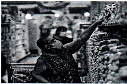
Em relação a novembro de 2020, a cesta básica em Belém subiu 13,18%, sendo a quinta mais cara do Brasil

O custo médio da cesta básica de alimentos aumentou em nove cidades com a pesquisa de novembro do Departamento Intersindical de Estatística e Estudos Socioeconômicos (Dieese). As maiores altas foram registradas em cidades do Norte e do Nordeste, como Recife (8,13%), Salvador (3,76%), João Pessoa (3,62%), Natal (3,25%), Fortaleza (2,91%), Belém (2,27%) e Aracaju (1,96%). O estudo levou em consideração os preços em 17 capitais. As informações são da Agência Brasil.