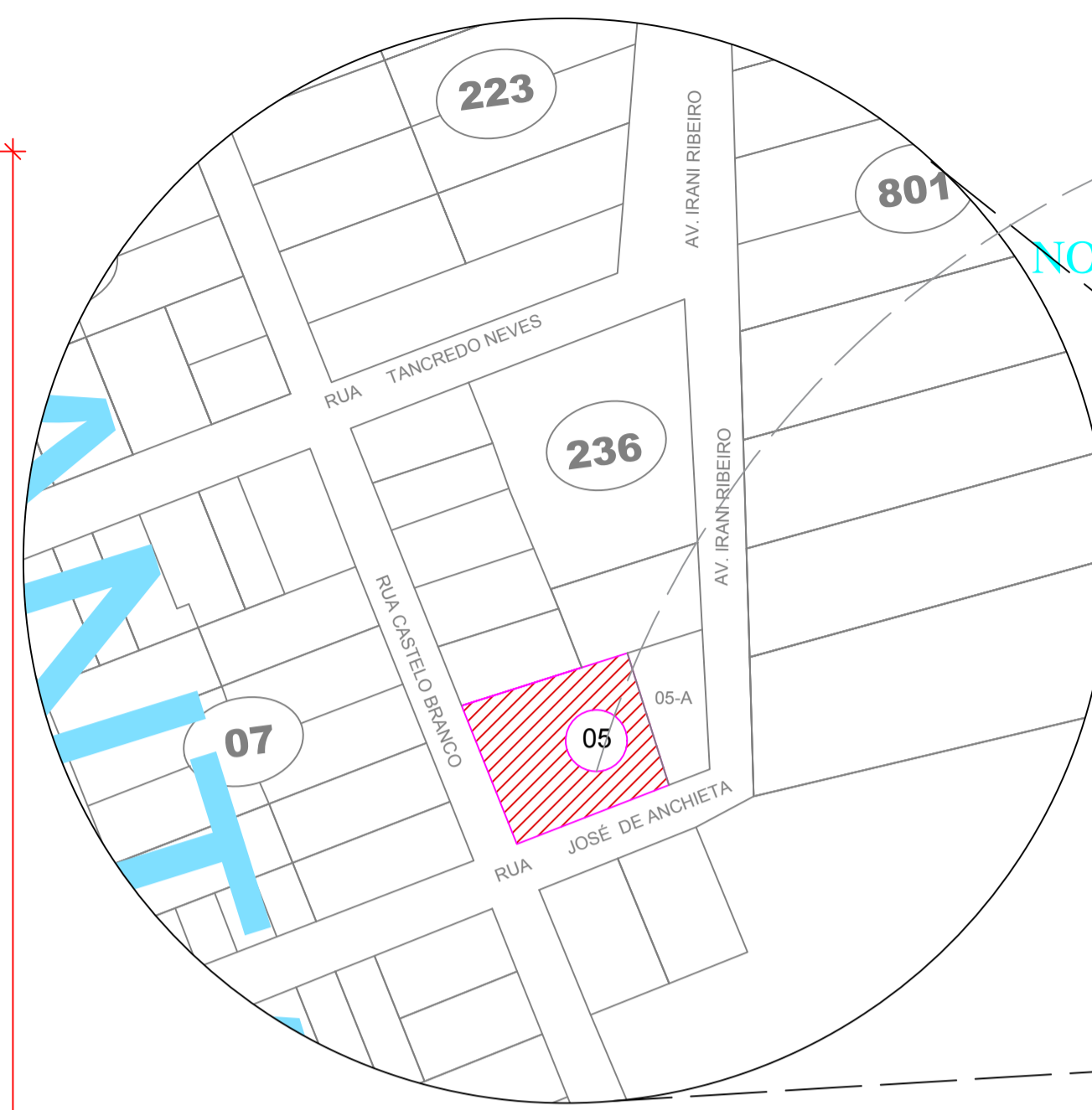
4 Planta de Situação Esc.: 1/1500