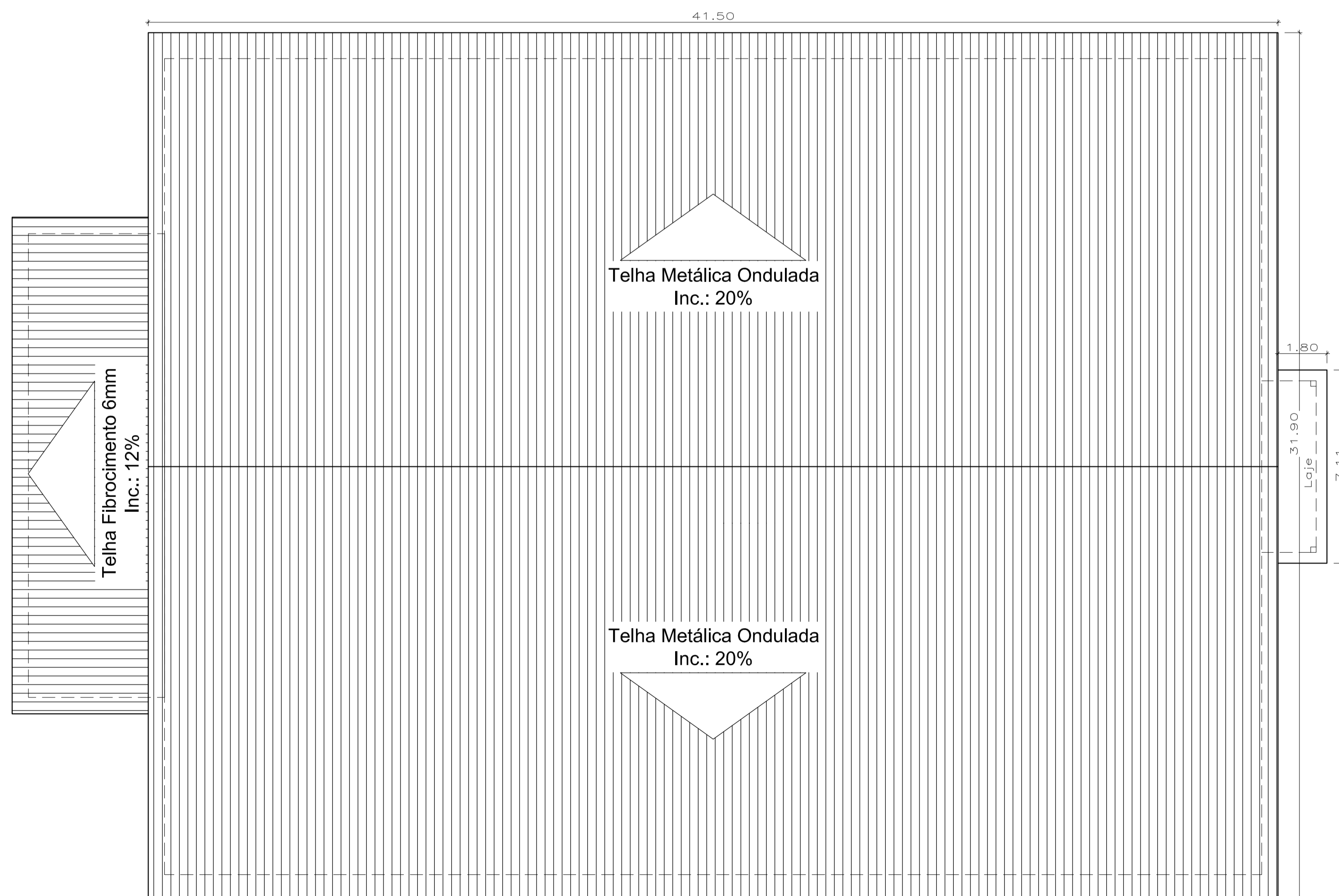
1 Planta de Cobertura Esc.: 1/100