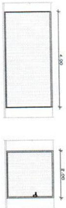
2 Vista Frontal dos Portões Esc. 1/50