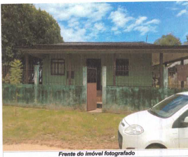
Frente do imóvel fotografado