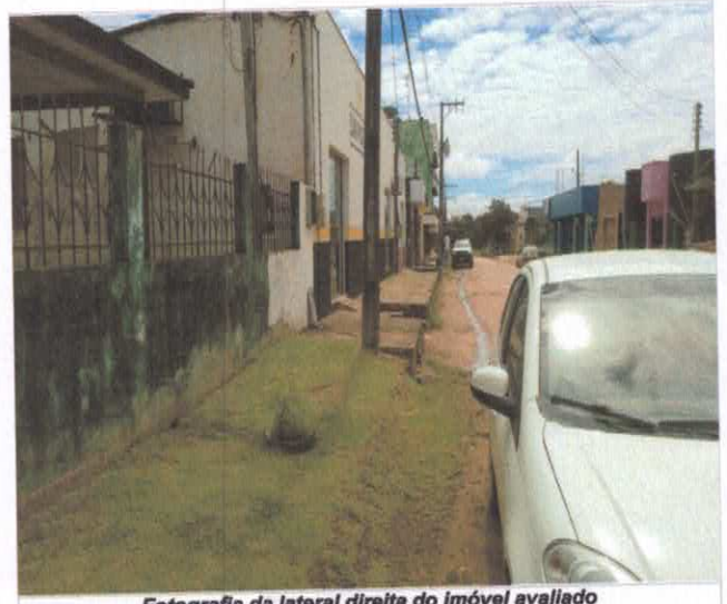
Fotografia da lateral direita do imóvel avaliado