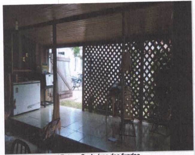
Fotografia da área dos fundos