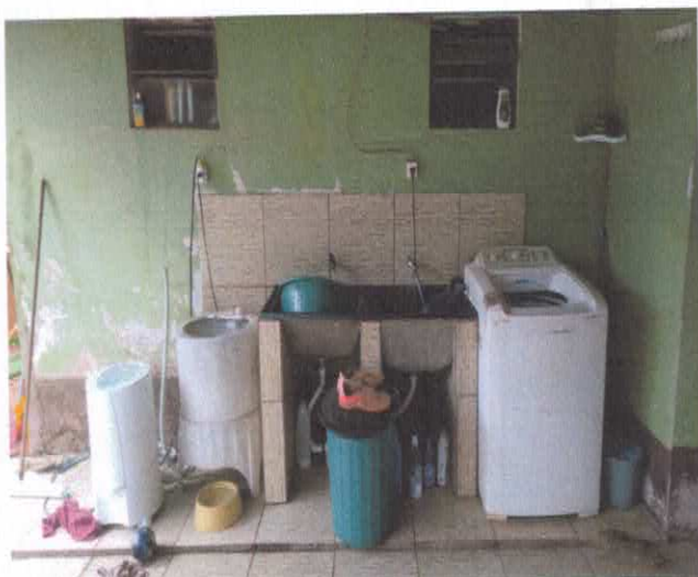
Fotografia da lavanderia