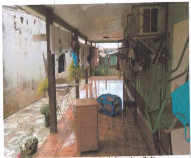
Fotografia da área direita do imóvel avaliado