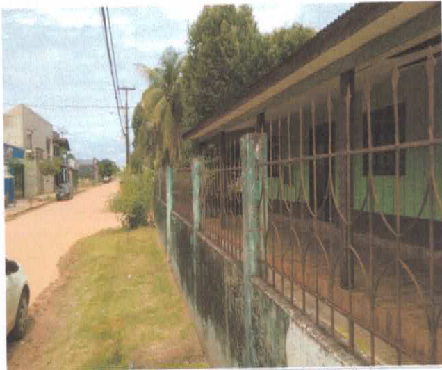
Fotografia da lateral esquerda do imóvel avaliado