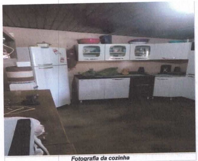
Fotografia da cozinha